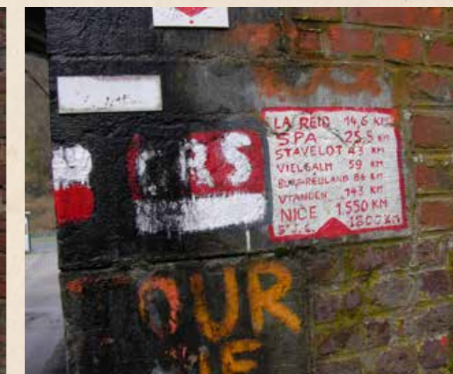
Sur le GR 5, la dernière balise originelle toujours visible aujourd'hui.