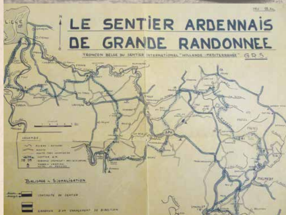
Une copie de carte dessinée à la main en 1964 par un certain E. Robyns (12 francs belges!).