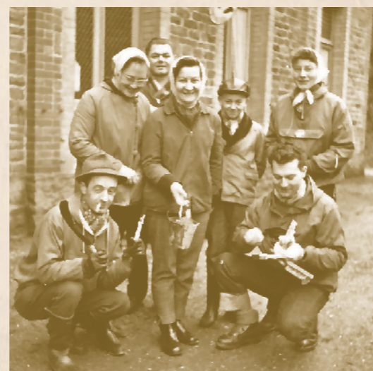
Voici 60 ans, les baliseurs du GR 5 avec pots et pinceaux. Le temps des pionniers.